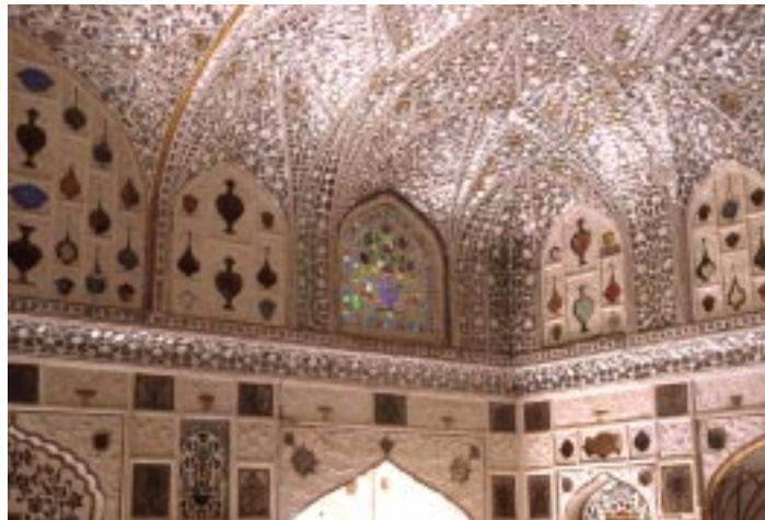
(Amber Fort - il palazzo degli specchi)

Questo è il viaggio, basta un unico condimento che serve per ogni dove, soprattutto amore per la gente, adattamento in casi un po' fatiscenti, e poi lasciarsi penetrare dal paesaggio, dagli ambienti, da una pietra che ti