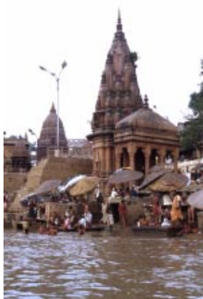
(Varanasi - il Gange)

Raccogliendo ora le sensazioni, rivivendole in questa nostra atmosfera così piatta ed apatica (a volte), rivisitando nei colori della nostra annunciata primavera i festosi contrasti policromi delle contrade dell'India, mi chiedo: dov'è la vera vita? Perché