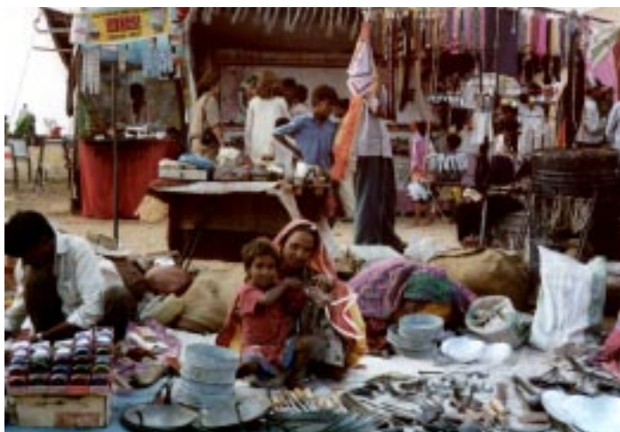
(Pushkar - la fiera)

Anch'io ho camminato pellegrina nel calore della folla colorata che andava all'alba ad offrire preghiere e fiori