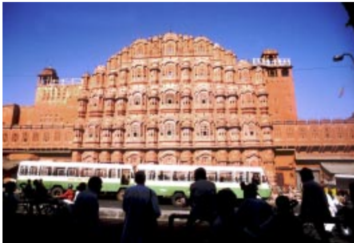
(Jaipur - il palazzo dei venti)