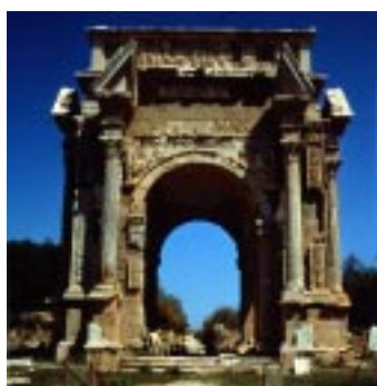
(Leptis Magna)