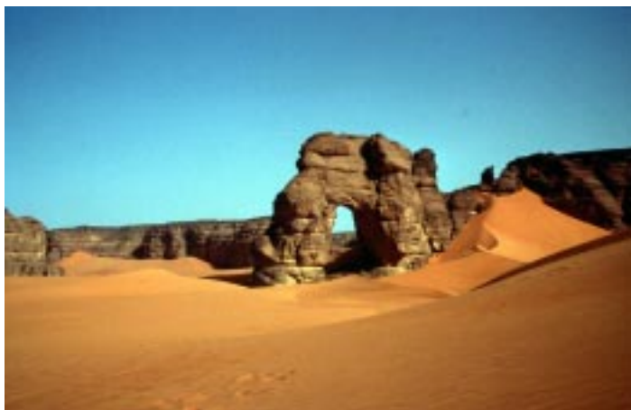
(Il deserto)

Eppure in questo paesaggio lunare e, a volte, alieno l'uomo ha lasciato e continua ad imprimere la sua impronta e la traccia del suo passaggio. L'antico popolo dei Garamanti che ha tramandato ai posteri la sua civiltà disegnando sulle pareti rocciose scene di vita, animali, gruppi pastorali, e simboli religiosi così come ha inciso i graffiti, misteriosi segni spesso difficili da interpretare ma così affascinanti da farci fermare a riflettere. Scene di un tempo in cui abbondante l'acqua solcava un paesaggio verde. Poi improvvisi, tra le dune i laghi Gabroun, Mandara, Mafu e Um El Ma, contornati da palme e papiri. Lo spettacolo è tra i più suggestivi ed irreali. Gli uomini attuali, discendenti