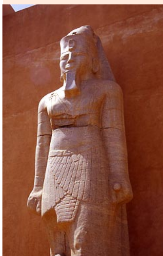
(colosso in granito)

un deserto che vive tra luce, tempo e storia pagg. 6 e 7