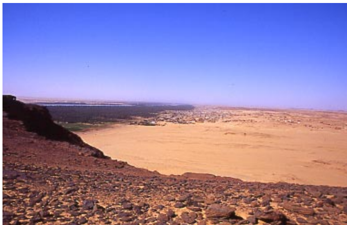
(il deserto)

Gli incontri con la gente sono stati a dir poco sorprendenti; è bastato avvicinarsi con gentilezza salutandoci con un "salaam aleykun" e rispondendo grazie e cioè "sukran" per ottenere un sorriso e una risposta altrettanto gentile. Ma soprattutto l'estrema ospitalità ci ha sorpresi: siamo stati invitati ad entrare nelle case;