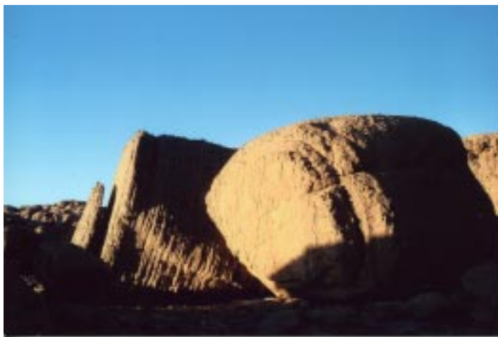
(il massiccio del Giabbaren)

Un'intera settimana nel Tadrart algerino - deserto dalle mille mutevoli bellezze - può sembrare, se pensata a freddo, immersi nei comfort della propria casa, una difficile impresa per l'assenza dei piccoli piaceri quotidiani: la doccia, una camera confortevole, lenzuola fresche... Non è facile spiegarlo a parole, ma di fatto tutte le comodità che costellano la nostra vita quotidiana si polverizzano insie-