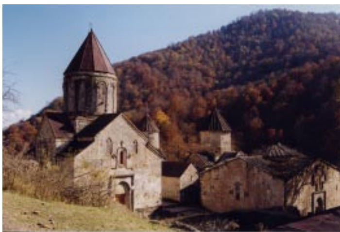
(Monastero di Hagharitsin)

Sono pochi gli stranieri a Erevan e si ha occasione di incontrare tutti. Conosco così il prof. Owen di Parigi, un signore dalla lunga barba bianca e l'aspetto del vecchio saggio e dolce. Il professore mi accompagna al mercatino delle pulci del sabato. Tra gli oggetti e vecchi ricordi, trovo le croci armene, i Khatkhar in miniatura, di legno o di tufo, lavorate con finezza, come quelle antiche. Intanto mi