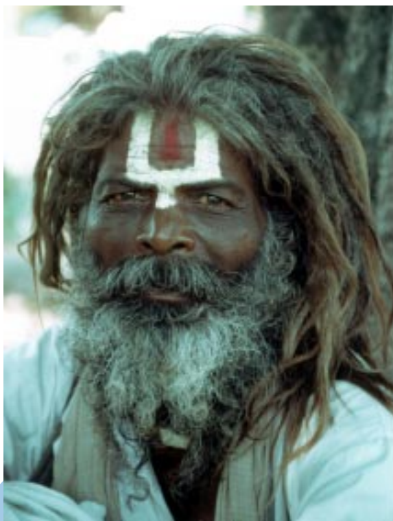
(Indiano Sadu)

La città di Haridwar si trova nel Nord dell'India, alle pendici dell'Himalaya, ed è nota in tutto il mondo per i suoi ashram e centri yoga. Anche le sorgenti del Gange, che nasce dall'Himalaya, non distano molto. Le sue acque, in questo punto, sono molto pulite e la corrente del fiume è impetuosa. L'ondata dei pellegrini che in tre mesi si riversa su questa città raggiunge la cifra di 15-20 milioni di persone. I dintorni di Haridwar, sono disseminati da tendopoli che le varie congregazioni religiose allestiscono per ospitare gratuitamente i fedeli. Le strade che portano ad Haridwar sono invase da pellegrini che, con ogni mezzo (a piedi, in bicicletta, con