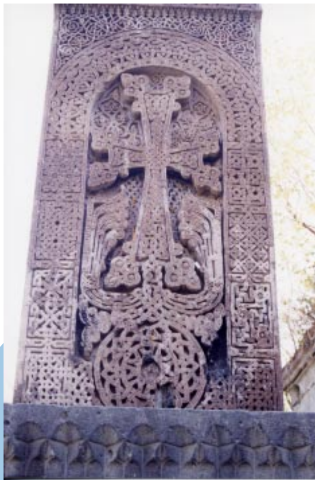
(Echmiadzin: croce armena)