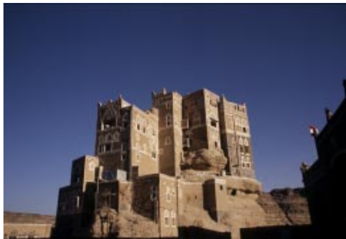
(Dear el Haijar, il palazzo sulla roccia)