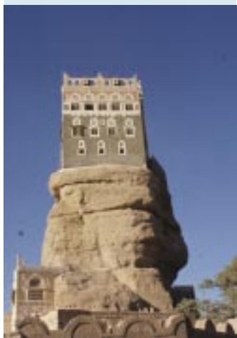
(Dear el Hajjar)