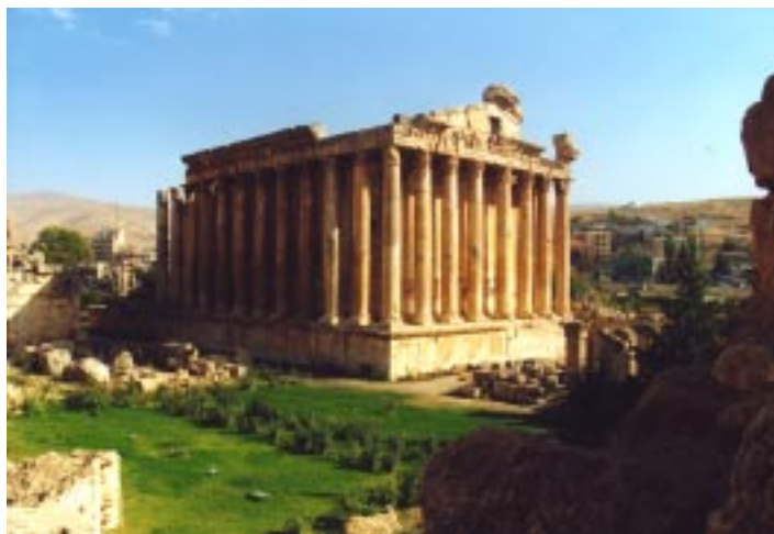
(Il tempio di Bacco a Baalbeck)

Prima del 1975, quando musulmani e cristiani maroniti convivevano in pace con tutti gli altri culti religiosi presenti in Libano, questo piccolo Paese, poco più grande del nostro Abruzzo, era definito la Svizzera del Medio Oriente. Da sempre crocevia di razze e culture diverse, posto all'incrocio tra Europa, Asia e Africa, il Libano era un esempio di convivenza pacifica tra i popoli. Tra il profumo dei cedri e il notevole afflusso di valuta pregiata, che riempiva i forzieri delle banche, il Paese poteva annoverarsi tra i più ambiti paradisi fiscali del Medio Oriente. Il tempo scorreva felice nella cosmopolita e ricca Beirut e i suoi abitanti, presi dalla dolce vita, se la godevano tra eleganti boutiques, ristoranti alla moda e le calde notti ai tavoli verdi del "Casinò du Liban" e, nelle stanze dell'Hotel Saint George, spie internazionali e spregiudicati commercianti d'armi concludevano i loro affari. Le cose iniziarono a cambiare negli anni sessanta quando, con la "Guerra dei sei giorni" (1967), Israele sconfisse Siria ed Egitto occupando Cisgiordania e il Golan, costringendo una massa enorme di profughi palestinesi, circa 500.000, a rifugiarsi nel sud del Paese. Ben presto questo cospicuo afflusso di profughi incrementò gli attriti con la comunità cristiana.