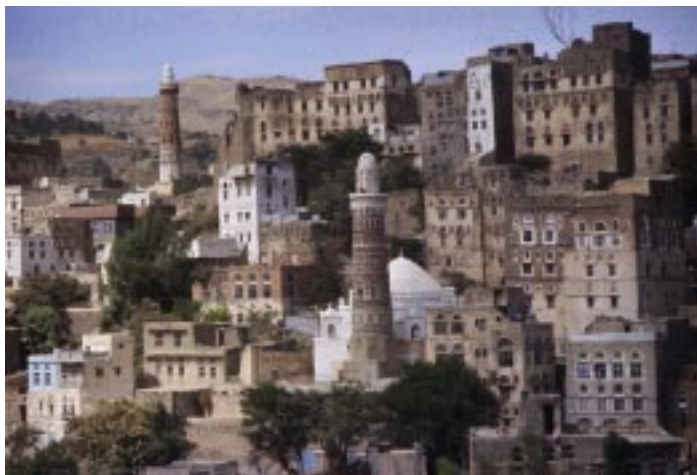
(Jibla)