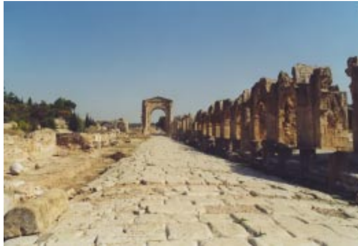
(Tiro: la città antica)

distrutto dalla guerra ha cambiato volto: 150.000 morti e un milione di emigrati all'estero, per lo più cristiani, sono il bilancio di 16 anni di guerra. Il complesso mosaico della convivenza ora è cambiato: con l'incremento demografico dei musulmani a discapito delle comunità cristiane, l'assetto politico è affidato alla maggioranza islamica. Oggi si tenta una lenta e difficile ricucitura dei rapporti di convivenza tra le diverse confessioni, compito arduo in un Paese strategicamente molto importante per l'equilibrio di tutto il Medio Oriente. Ora il nuovo aeroporto di Beirut accoglie i viaggiatori con i suoi splendidi marmi di Carrara, deserto e lindo, segno inequivocabile della normalizzazione in atto dopo una devastante guerra civile. Le case sbrec-