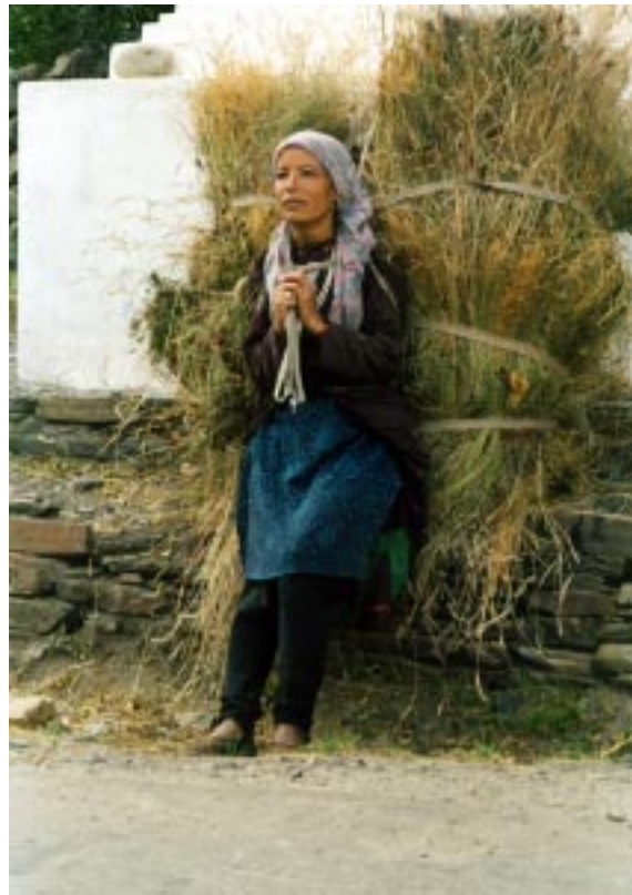
(donna al lavoro)

mille braccia, le divinità sorridenti oppure terrificanti, Tara, nata da una lacrima di Buddha, i mille Buddha di Alci, templi ricchi di iconografie complesse, monaci che cantavano i mantra con voce profonda, gutturale accompagnati dal suono di giganteschi strumenti a fiato che ripetevano la stessa melodia tanto da esserne ipnotizzati, i 100 e più volumi del Tan'gyur, raccolta di regole monastiche, di serie di sutra e tantra, ognuno avvolto in teli e conservati gelosamente dai monaci, i mandala dipinti della Ruota del Tempo, i Buddha dalle teste sovrapposte rappresentanti conoscenza, saggezza e metodo, o i gioielli di Stock Palace assieme a preziosi tankha riccamente decorati, le Dzi stones, pietre che provengono dal Tibet con uno o tre occhi che hanno il potere di allontanare i demoni o preziosi Queen's Perag, copricapi ricoperti di turchesi. Ma appena girato l'angolo si è inghiottiti da vicoli con case annerite dal fumo dei piccoli forni che cuociono chapati, con le finestre senza vetri come orbite vuote che fanno intravedere al loro interno pavimenti di terra e tanta miseria; per passare da