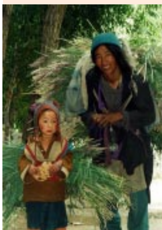
(scena di vita quotidiana)