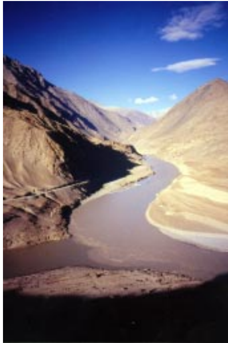
(confluenza dei fiumi Indo e Zaskar)

Beh sì, è pur vero che si tratta di un vero e proprio deserto di alta quota, dove piove meno che nel Sahara in quanto le altissime catene montuose che lo