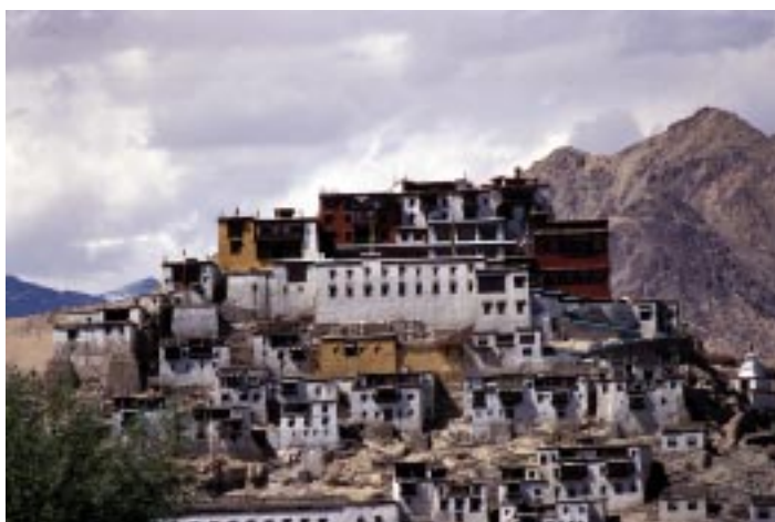
(monastero di Thikse)

Con la prima soluzione si avrà un brusco impatto con l'altitudine. Leh è a 3.600 metri, il fisico non ha avuto il