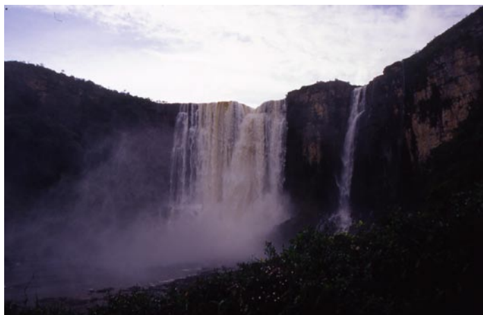
(Salto Angel)

Risalendo con una curiara (canoè degli indios Pemón) il fiume Caronì s'incontra la cascata Aponwao: con un salto di 105 metri cade rumorosamente in un cañon scavato dalla continua erosione degli elementi naturali. Dal Salto Kama due getti d'acqua gemelli precipitano parallelamente nel fiume sottostante. Si cammina