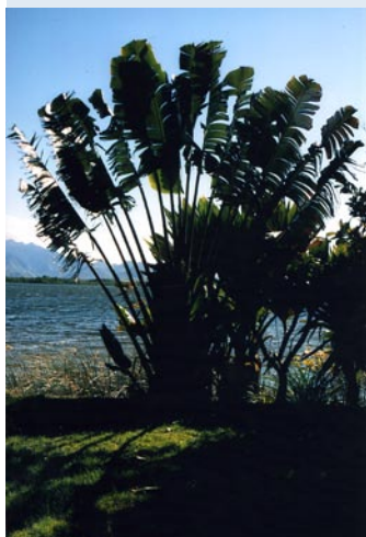
(palma del viaggiatore)