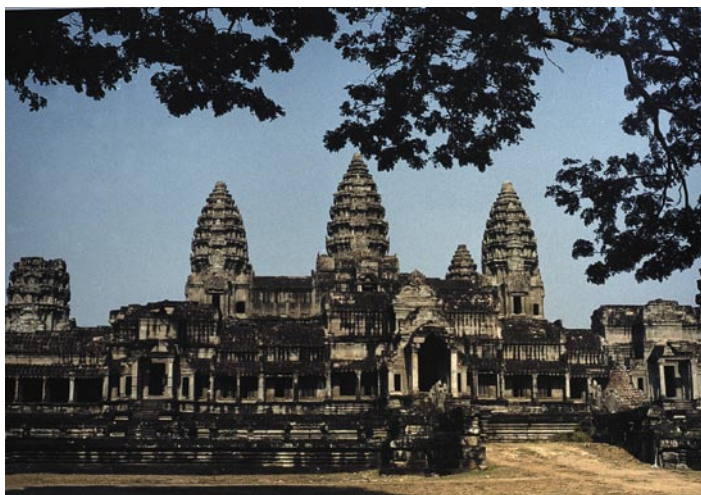
(Angkor Wat)

Ci sono dei suoni che caratterizzano i paesi e sembrano onnipresenti in quella realtà: nella mia mente New York è associata al suono lacerante delle sirene che, giorno e notte, invadono l'aria fino ai piani più alti dei grattacieli; l'Iran ai richiami dei muezzin che si rincorrono da un minareto all'altro; l'India dal traffico caotico e puzzolente e dal vociare dei bambini; il Ladakh dal suono cupo, profondo dei canti dei monaci accompagnati dal suono altrettanto profondo degli strumenti a fiato; la Cambogia dal ronzio continuo dei televisori nei ristoranti e alberghi che competono con i gechi giganti. Ma il suono che veramente colpisce in Cambogia, al di fuori dei locali pubblici, è l'assordante silenzio che riempie la mente durante le visite a quelli che sono tra i più affascinanti siti archeologici del mondo. Ma il silenzio ci cala addosso molto prima, nel momento in cui si entra nel museo del genocidio a Phnom Penh dove, nonostante la gente, non si sente alcun vociare. Sembra che nessuno, di fronte a tanto orrore, abbia più parole per esprimere e qualificare il sentimento di oppressione derivato da ciò che gli uomini possono fare contro i propri simili. Un profondo senso di tristezza ti invade e sembra non volerti più lasciare, sembra di leggerlo sui visi della gente con cui incroci gli sguardi, nei visi dei bambini e delle ragazze che tentano un sorriso. Neppure le poche macchine che circolano riescono a far rumore: