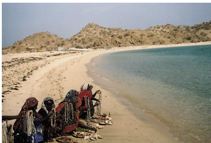
(Isole Dahlak)

Gli autoctoni sono generalmente alti e snelli con dei lineamenti molto fini ed espressivi. Mi ha colpito la lunghezza del collo di certe donne, l'estrema eleganza e la flessuosità dell'incedere. La bellezza dei sorrisi aperti e genuini con degli splendidi e bianchissimi denti. Per curiosità