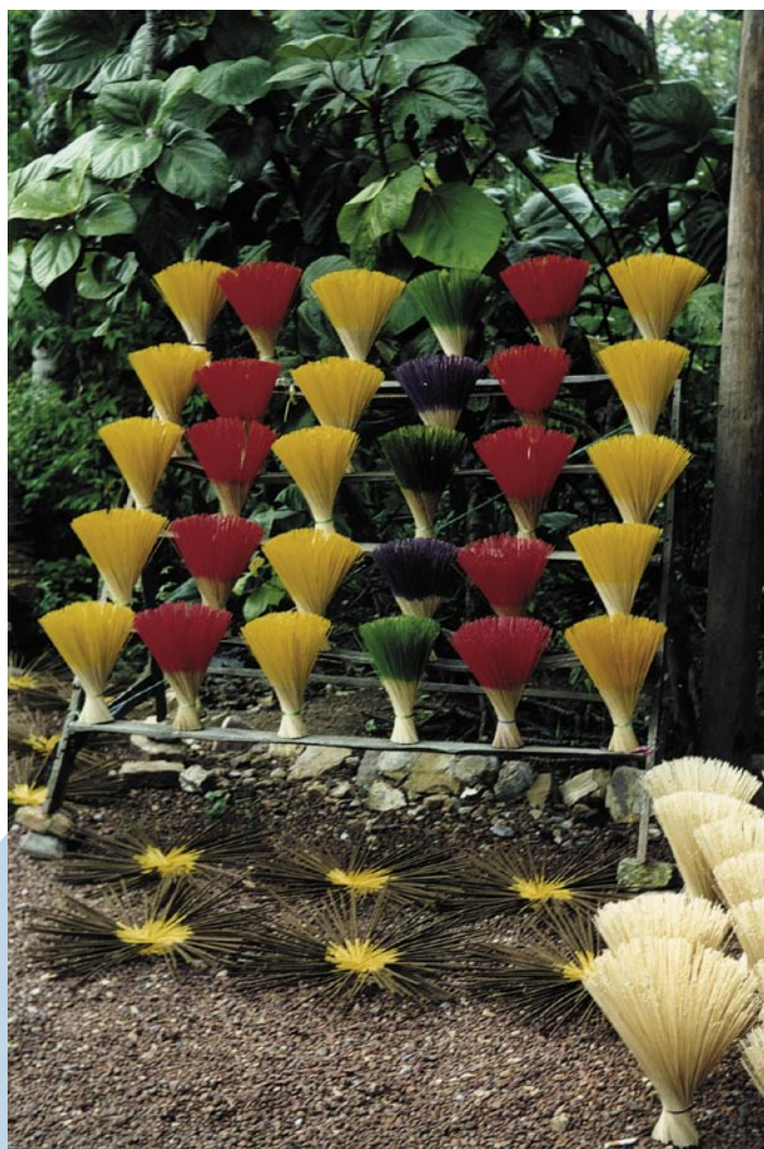
("ventagli" d'incenso)

Una località come Angkor (Cambogia), patrimonio mondiale dell'umanità, è fra le più visitate sulla terra e nell'attiguo villaggio di Siem Reap che ha in parte mantenuto la sua fisionomia arcaica, sono sorti e sorgono alberghi di gran lusso, decisamente occidentali. Ma basta arrivare sulle sponde del lago sacro che circonda il sensazionale luogo sacro dell'Angkor Vat e attraversare il ponte le cui spallette sono costituite dai sacri serpenti Naga, che si entra in un'aura diversa. Il fascino viene dai tanti edifici sacri, voluti dai civilissimi re Khmer, e dalla lussureggiante vegetazione tropicale che li avvolge, tanto che spesso giganteschi alberi avviluppano i sacri templi come mostruosi serpenti pronti a strangolarli. Siamo quasi al centro del paese, compreso fra Thailandia, Laos e Vietnam. La Cambogia