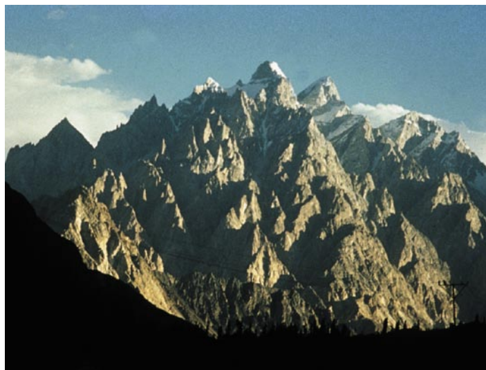
(Il Karakorum)

L'avventura inizia da Karachi, caotica e misera, con un coloratissimo bazar dai vicoli stretti, ciascuno specializzato in merce diversa. L'aroma del tè e del cardamomo riempie l'aria, si mescola al legno di sandalo, al tabacco e all'incenso in un cocktail inebriante. Trionfa il mango, frutto nazionale. C'è grande frastuono al fish harbour, centinaia di colorati pescherecci e un continuo via vai di ragazzini che scaricano il pescato quotidiano. Se Karachi non ha bellezze artistiche, Lahore, la cui città vecchia risale ai Moghul, ci incanta con la sua eleganza raffinata, tra palazzi di marmo, padiglioni arabescati di stucchi e moschee. Il più bel giardino ricco di fontane è quello di Shalimar (1642), costruito per gli svaghi della famiglia reale, ora meta di vocianti famigliole accoccolate sull'erba tra cinar e magnolie a consumare il pic-nic. Il tour del Karakorum inizia dalla valle di Kaghan da cui parte la strada che collega il Pakistan alla Cina, lungo l'antica via della seta disseminata di incisioni su pietra risalenti al I a.C., opera di mercanti, missionari buddisti e pellegrini in viaggio da e per la Cina. Paesaggi da cartolina, cielo azzurro smalto, aria rarefatta e luminosa. Distese di albicocche a seccare sui tetti delle case, colore e polvere ovunque, anche nei nostri polmoni.