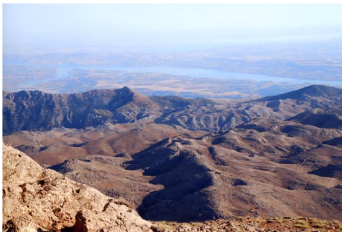
(un panorama mozzafiato)

Se siete interessati alla storia degli Ittiti, un popolo che rap-