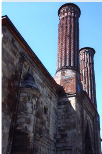
(Erzurum - Madrasa)