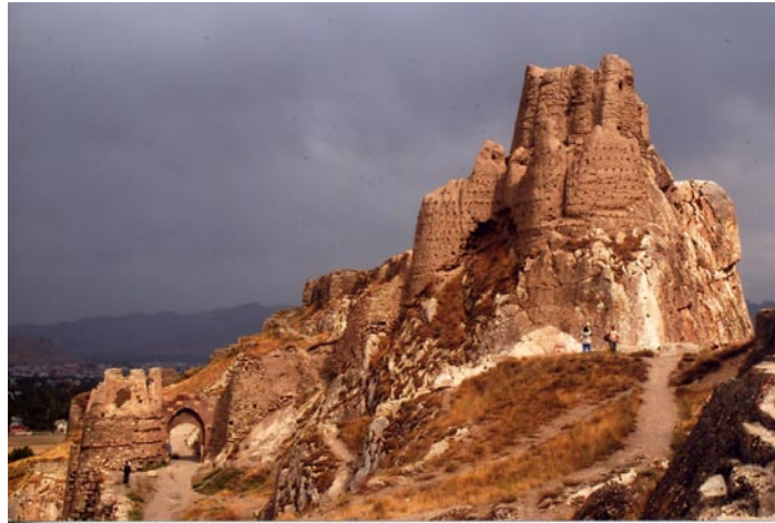
(la fortezza di Van)

I monti hanno uno strano colore rossastro e con un verde della vegetazione che sale oltre le nostre usuali quote alpine. Non dimentichiamoci che siamo ad una latitudine più bassa ed il calore si fa sentire. I paesi curdi sono primitivi e molto spesso arroccati