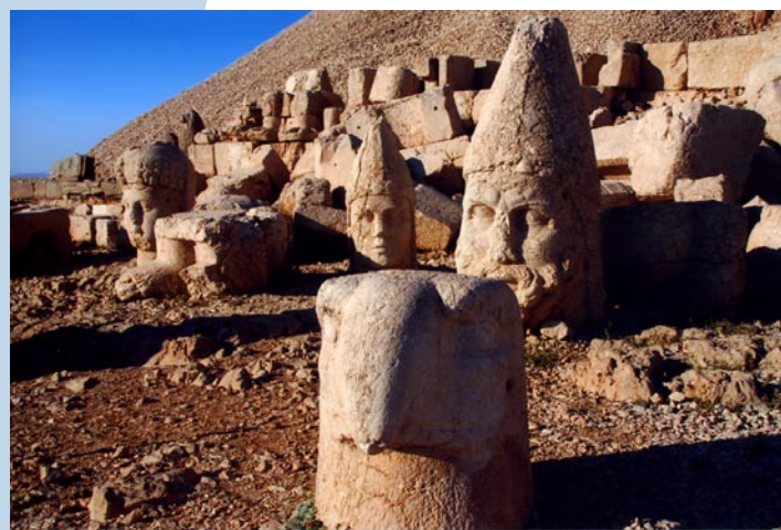
(Il Nemrut Dagı)

Un cammino attraverso le radici millenarie della storia, ove il cuore palpita come nella poesia di Tumanian Perché voli cuore folle demone seguendo mille cose? Potessi anch'io giungere in mille luoghi come te cuore con slancio leggero.