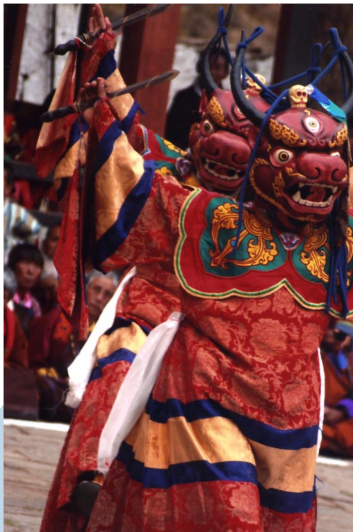
(Danze dei Monaci al Festival di Paro)

narici, stordendo. Per terra macchie rosse, resti di cercata inebrietà. Un girotondo coi bambini che alla terza volta già lo ripetevano in italiano. E il gioco della campana, uguale là come qua, migliaia di chilometri cancellati nell'attimo di un gioco condiviso.