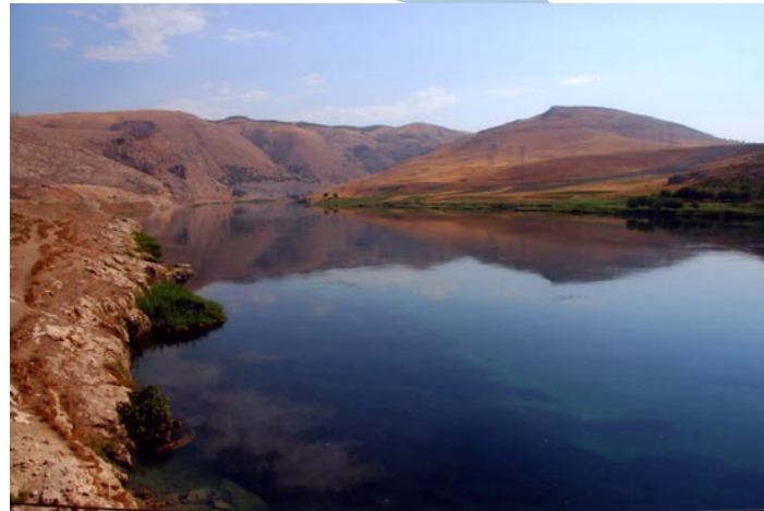
(zona di Sanliurfa)

Rapiti camminiamo in rispettoso silenzio. L'unico suono è quello degli uccelli, mescolato al rumore che soffia lungo i canaloni. Sotto l'occhio attento delle guardie del confine armeno, raggiungiamo la Chiesa del Redentore. Tracce di affreschi raccontano le vite dei santi, il vangelo. Un vociare attira la nostra attenzione. La guardia sta discutendo con due uomini. Sono vestiti in abiti neri, una folta barba nera incornicia i loro volti. Sono armeni. Sono vescovi armeni. Sono arrivati ad Ani attraversando la Georgia. Nei loro occhi la gioia di camminare nella città dei padri, la capitale della Grande Armenia, intravista ogni giorno attraverso il reticolato di un confine invalicabile. E poi in un anfratto di una rovina uno sbattere d'ali. Due piccole bocche voraci che si agitano per avere il cibo. Qui una rondine ha costruito il proprio nido, qui la vita continua e l'animo della Grande Armenia non muore.